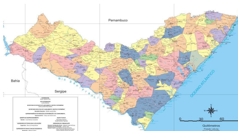
Figura 1 – Mapa Político-administrativo de Alagoas (2015)