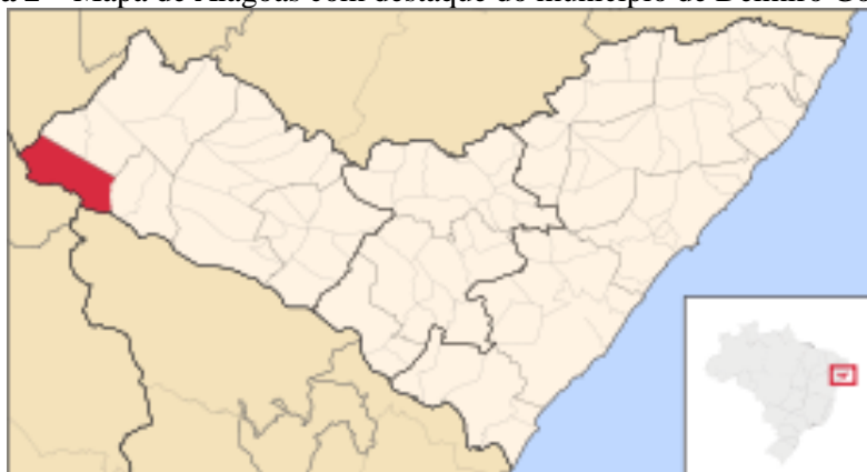
Figura 2 – Mapa de Alagoas com destaque do município de Delmiro Gouveia (2016)